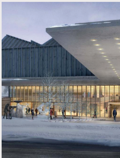
Latvijas Laikmetīgās mākslas muzeja vizualizācija.

Saskaņā ar ziņojumu KM izvirzīja nākamās darba uzdevumus, lai turpinātos darbs pie muzeja izveides ieceres realizācijas. 2024. gadā panākta konceptuāla vienošanās, ka no 2025. gada Latvijas Nacionālā mākslas muzeja struktūrā darbību uzsāks Latvijas Laikmetīgās mākslas muzeja pirmie darbinieki, kuru amata pienākumi būs saistīti ar kolekcijas papildināšanu un pētniecību, kā arī tuvāko gadu laikā tiktu nodrošināti līdzekļi mākslas darbu iepirkuma veikšanai. Šāda rīcība nostiprinātu partneru pārliecību par muzeju kā nacionālu prioritāti un tā saturisko gatavību darbībai, ja tiktu uzsākta ēkas būvniecība.