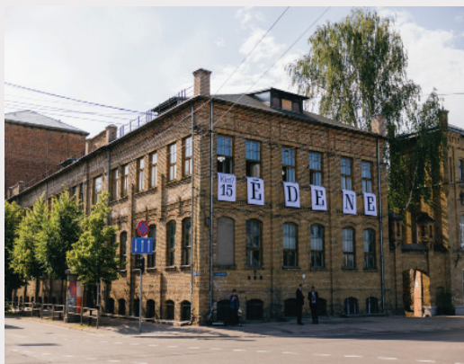
Starptautiskā laikmetīgās mākslas festivāla "Jauna adrese: ĒDENE" norises vieta Hanzas ielā 22.

Pērn fonds finansiāli atbalstīja Starptautiskā laikmetīgās mākslas festivāla "Jauna adrese: ĒDENE" organizēšanu par godu biedrības "Kim?" 15 gadu jubilejai. "Kim?" ir mākslas centrs, kas pievērsies visdažādākajām idejām, žestiem, tekstūrām un intervencēm. Centra paspārnē tapušas vairāk kā 200 izstādes, un tas turpina iedziļināties, uzdot jautājumus un veidot arvien jaunas izstādes.