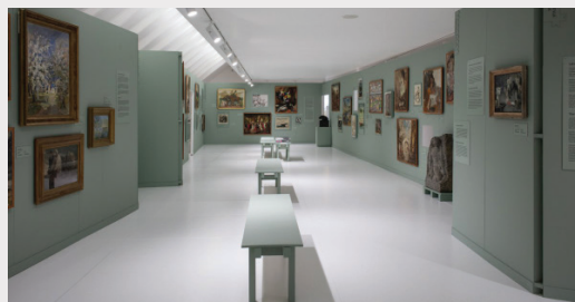
Izstāde "Latvijas kolekcija" Latvijas Nacionālā mākslas muzeja telpās.

2024. gada nogalē ar fonda līdzfinansējumu Latvijas Nacionālā mākslas muzeja galvenās ēkas 4. stāva un Kupola zālēs norisinājās izstāde "Latvijas kolekcija", kuru organizēja biedrība "Latvijas Laikmetīgās mākslas centrs" sadarbībā ar Malmes Mākslas muzeju Zviedrijā un Latvijas Nacionālo mākslas muzeju. Izstāde demonstrēja 20. gadsimta sākuma Latvijas mākslinieku darbus no Malmes muzeja krājuma un tos papildinošus mūsdienu autoru jaundarbus. Projekta mērķis – atsegt būtiskus kultūrslāņus Latvijas vēsturē un mākslas vēsturē, radot platformu ikvienam interesentam iepazīt un apzināt: kolekciju veidošanās nosacījumus un to pavadošos naratīvus; muzeju un mākslinieku lomu nacionālu valstu naratīva un starpvalstu diplomātijas veidošanā. Projekta īstenošana turpināsies 2025. gadā.