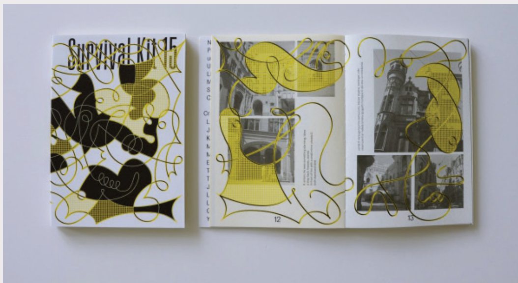
Laikmetīgās mākslas festivāla SURVIVAL KIT izglītības programmas materiāli.

Centrs veido mākslas notikumus un izstādes, pētniecības un izglītības projektus un publicē izdevumus, kuros pievēršas gan aktuālākajiem mākslas un sabiedrības procesiem, gan pagātnes norišu pārskatīšanai. Uzmanības centrā ir Latvijas, Baltijas, Austrumeiropas un plašāka postsociālisma reģiona konteksti, izcelti arī dzimtes un minoritāšu jautājumi, individuālās un kultūras atmiņas slāņi, vides un ekoloģijas perspektīvas. Centram nozīmīga ir sadarbība ar vietējiem un starptautiskiem māksliniekiem un institūcijām, kas atspoguļojas arī tā darbībā, – izstādes, izglītības programmas un citas norises tiek īstenotas muzejos, skolās, bibliotēkās, tukšās ēkās un pilsētvidē. Viens no šādiem notikumiem ir starptautiskais laikmetīgās mākslas festivāls SURVIVAL KIT.