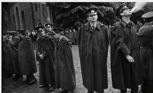
Jāņa Deinata fotogrāfija "Milicija pie Augstākās Padomes ēkas" (1990), Latvijas Nacionālais mākslas muzejs.

Izstādē tika eksponēti 103 darbi, izstādes norises laikā notika vairākas tikšanās ar autoru un izstādes kuratori dažādām auditorijām, kā arī tikšanās ar Daini Īvanu – pirmo Latvijas Tautas frontes priekšsēdētāju un aktīvu neatkarības kustības līdzdalībnieku. Kaut izstāde attēloja 30 gadus senus pagātnes notikumus, paradoksālā kārtā tā izvērtās par laika aktualitāti, kad atkal atrodamies neatkarības draudu priekšā.