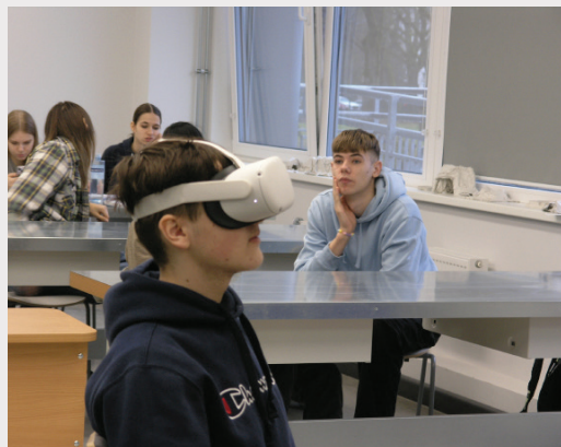
Izstādes "Māksla uz riteņiem" izglītības programmas pasākums.

Projekta tūres ietvaros tika apceļotas 50 vietas Latvijā, galvenokārt skolas visos Latvijas novados, un divas vietas Norvēģijā. Projekts ir pārsniedzis savu sākotnējo plānoto apmeklētāju skaitu, paredzēto 2 000 apmeklētāju vietā to pieredzējuši 7 621 bērns/jaunietis, meditācijas metodēs apmācīti 8 mākslas mediatori, 102 skolotāji. 81,2% apjautāto skolēnu šī izstāde bija pirmā sastapšanās ar laikmetīgo mākslu.