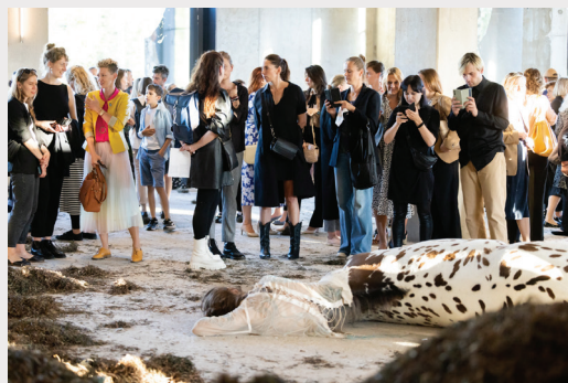
Laikmetīgās mākslas izstādes “MŪSU MĀJAS BIJA ZEME. UZPLAUKUMS” atklāšana “New Hanza” biroju ēkā Mihaila Tāla ielā 1.