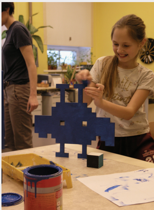
Izstādes "Māksla uz riteņiem" izglītības programma.

2023. gadā darbojās programma "Izglītības projekti", kuras mērķis ir veicināt sabiedrībā izpratni par izglītības nozīmi kopumā, kā arī par laikmetīgo mākslu, tās saturu un formu. Ar programmas palīdzību pirmsskolas, bērnudārza, skolas vecuma bērnos un augstskolu studentos rosinām izpratni par muzeju kā aizraujošu un stimulējošu vidi attīstībai. Tāpat veicinām kvalitatīvu mākslas izglītības apguvi, atbalstot izglītojošo spēļu attīstību un radīšanu, rīkojot diskusijas, vieslekcijas, seminārus, konferences, praktiskās nodarbības studentiem, nozaru speciālistiem un citiem jomas interesentiem.