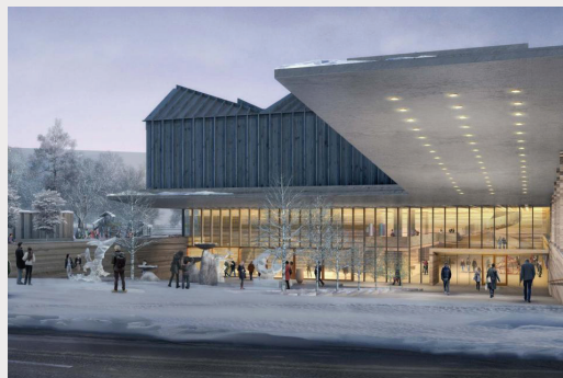
Latvijas Laikmetīgās mākslas muzeja vizualizācija.

par Latvijas Laikmetīgās mākslas muzeja būvniecības ieceres realizācijas iespējām”, kurā piedalās tai skaitā Latvijas Laikmetīgās mākslas muzeja fonds. Ir atrasts risinājums Latvijas Laikmetīgās mākslas muzeja būvniecībai – potenciāli būvēt muzeja ēku saskaņā ar privātās-publikās partnerības (PPP) projektu, Rīgas domei uzņemties publiskā partnera lomu. Panākts, ka muzejs kā prioritāte ir iekļauts Evikas Siliņas valdības rīcības plānā, nosakot divus uzdevumus – izveidot Latvijas Laikmetīgās mākslas muzeja darbības institucionālo vienību un sākt paplašināt muzeja krājumu, kā arī uzsākt Latvijas Laikmetīgās mākslas muzeja projekta īstenošanu ar Rīgas valstspilsētas pašvaldību, kā projekta realizēšanas modeli piedāvājot PPP.