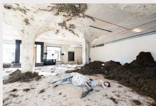
Laikmetīgās mākslas izstādes “MŪSU MĀJAS BIJA ZEME. UZPLAUKUMS” scenogrāfija un mākslas darbs.