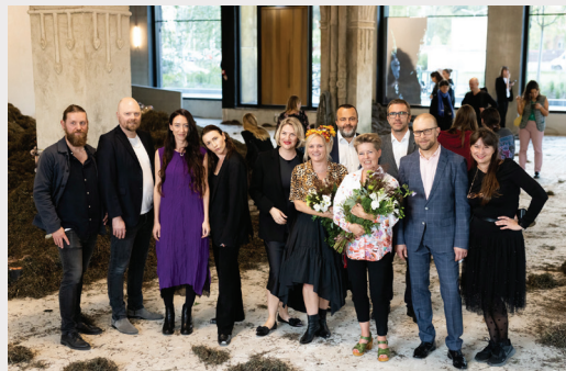
Laikmetīgās mākslas izstādes "MŪSU MĀJAS BIJA ZEME. UZPLAUKUMS" komanda.