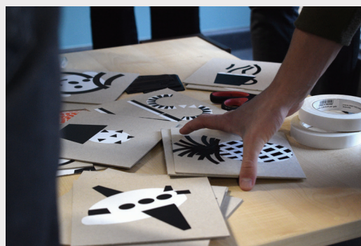
Izstādes "Māksla uz riteņiem" izglītības programma.

Mākslas centrs "NOASS" ir mākslinieku vadīta organizācija ar vairāk nekā divdesmit gadus ilgu darbības vēsturi. Biedrību 1998. gadā izveidoja mākslinieki un kultūras nozares profesionāļi, lai ar laikmetīgās mākslas un kultūras palīdzību runātu par aktuālām norisēm sabiedrībā, tās problēmām un iespējamajiem risinājumiem. "NOASS" apvieno dažādu jomu profesionāļus, rada kopprojektus, eksperimentē, meklējot jaunus radošās izteiksmes veidus, materiālus, izmantojot jaunākās pieejamās tehnoloģijas un mērķtiecīgi veidojot daudzveidīgu pasākumu programmu, lai palīdzētu ieraudzīt, sadzirdēt, sajūst un domāt.