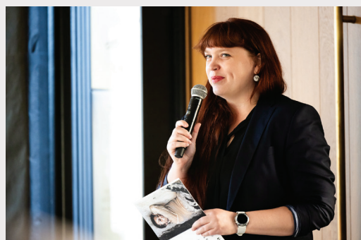
Laikmetīgās mākslas izstādes “MŪSU MĀJAS BIJA ZEME. UZPLAUKUMS” atklāšana “New Hanza” biroju ēkā Mihaila Tāla ielā 1. Latvijas Republikas kultūras ministres Agneses Loginas uzruna.

Fonds “Novum Riga Charitable Foundation” izsaka vislielāko pateicību izstādes producentam un rīkotājam – nodibinājumam “Latvijas Laikmetīgās mākslas muzeja fonds”, kā arī pateicas par atbalstu Dānijas karalistes vēstniecībai, “New Hanza Biroji”, “Pillar Capital”, Dānijas kultūras institūtam, “Nordic – Baltic Mobility Programme”, “Repository of Knowledge”, Latvijas Nacionālajai bibliotēkai un “Ziedoņa klasei”, kā arī “LSM”, “Latvijas Radio”, “Clear Channel” un “SWH”.