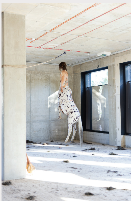
Laikmetīgās mākslas izstādes “MŪSU MĀJAS BIJA ZEME. UZPLAUKUMS” scenogrāfija un mākslas darbs.

Pavadošā programma iekļāva mākslinieku lekcijas, izglītības programmu vidusskolēniem, kas tika pievienota “Latvijas Skolas somas” programmai, kā arī diskusiju ciklu. Izstāde tās norises laikā sasniegusi vairāk kā 600% no plānotās kopējās apmeklētāju auditorijas, proti, to apmeklējuši teju 24,5 tūkstoši cilvēku no Latvijas un ārvalstīm. Bezmaksas izstādi apmeklēja arī skolēni, turklāt ne tikai no Rīgas, bet arī no Jelgavas, Ikšķiles, Vecumniekiem, Salaspils, Cēsīm, Talsiem un Ogres.